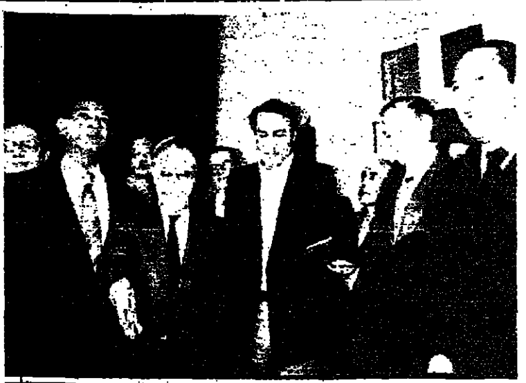
السيد صادق قطب زاده وزير الخارجية الايراني يحيط به اعضاء لجنة التحقيق الدولية الخماسية

وقال السيد جديون هاوزر من كتلة الاحرار المستقلين ان الامم المتحدة تشكل ان عقابا امام السلام واكد ان القدس لن تقسم ثانية كما اكسد ان المستوطنات الحيوية لقتضيات الامن لن يتم اخلاعا .